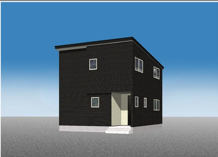
カーナビ検索:長岡市与板町東与板322-3付近